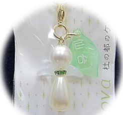
ケヤキの精ストラップ