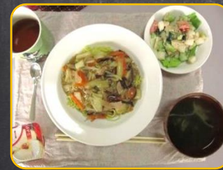
●7月 あんかけ焼きそば