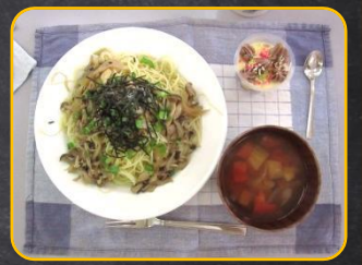
●9月 おろしきのこパスタ