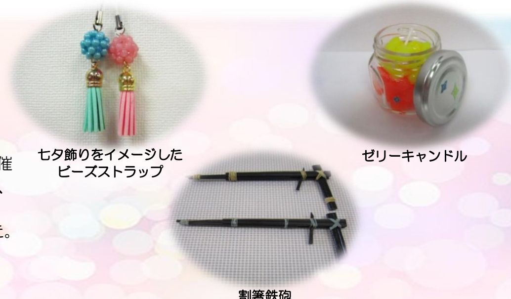
七夕飾りをイメージした ビーズストラップ