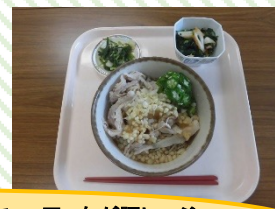
左がピピン丼とスープで281円、右が豚しゃぶおろしそばに副菜が付いて289円でした！